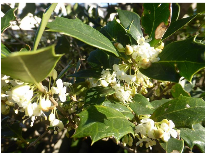
《ヒイラギ：モクセイ科》