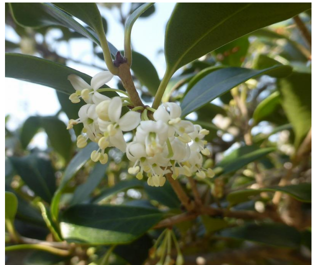
《マルバヒイラギ：モクセイ科》

＝可憐な白い花から良い香りが漂う。キンモクセイと共に魔除けの効果があるとされ、 鬼門の方角に植えられる＝