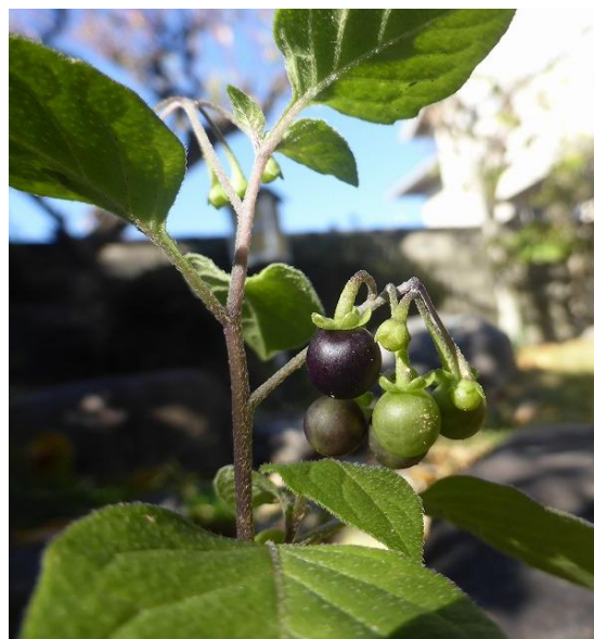
《アメリカイヌホオズキの実：ナス科》 =黒い実に毒がある=