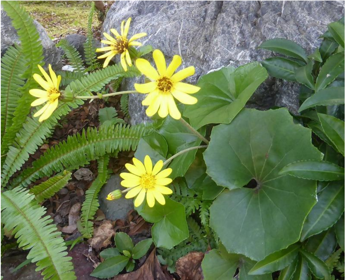
《ツワブキ：ヒキク科》 花言葉：「謙譲」「困難に負けない」 原生地：東アジア