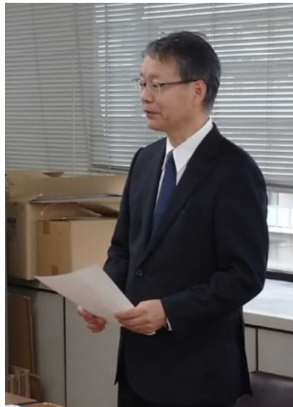
校長会会長あいさつ