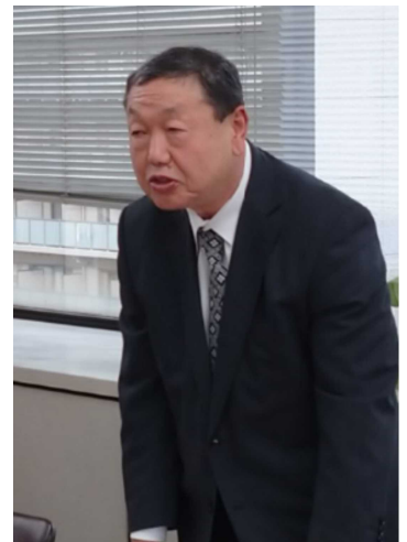
グループ活動報告