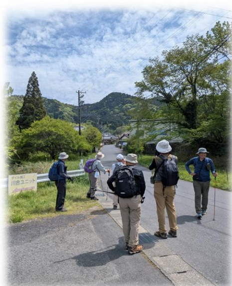
【帰路、笠原富士を見上げて】