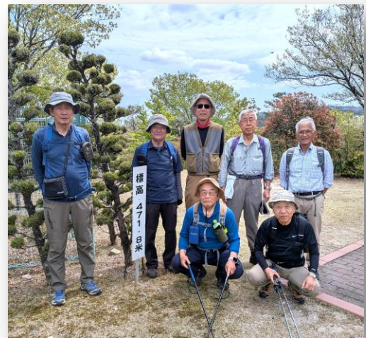
【展望台下最高地点】