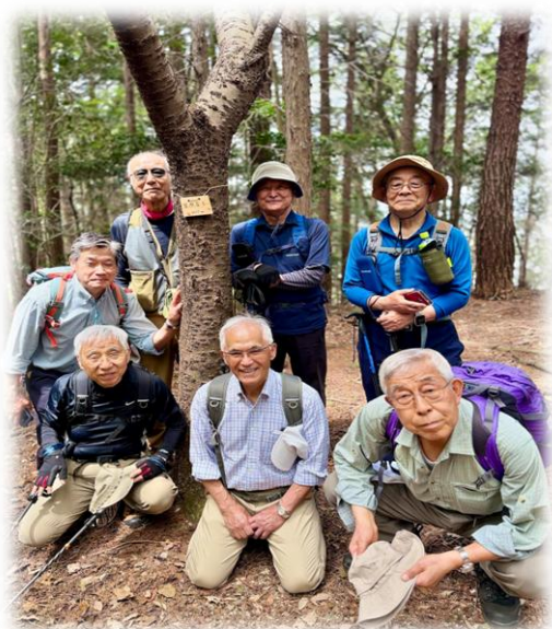
【笠原富士山頂上にて】